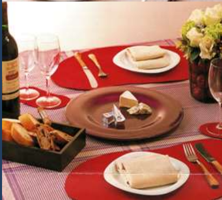
雑誌のスタイリングより